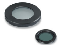
Unidad de polarización sencilla