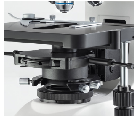
OBN-15: Montierter Phasenkontrastkondensator