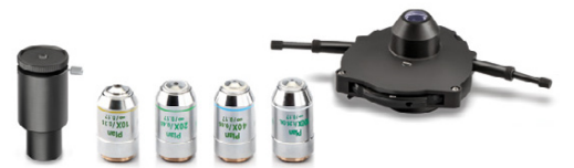
5-fach PH-Universal-Drehkondensator mit 10×/20×/40×/100× Infinity-PH-Plan-Objektiven (Komplett-Set, bei OBN-15 inklusive)